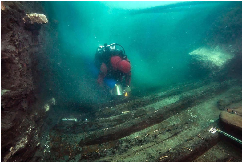
Ein Taucher erkundet das antike Kriegsschiff.

Ein Team aus ägyptischen und französischen Archäologen und Archäologinnen fand bei einer Ausgrabung in der versunkenen Stadt Thonis-Herakleion unter Wasser ein 25 Meter langes Kriegsschiff. Es handelt sich um einen extrem seltener Fund.